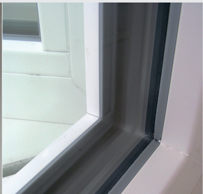
UNIGLAS TPS ABSTANDHALTER